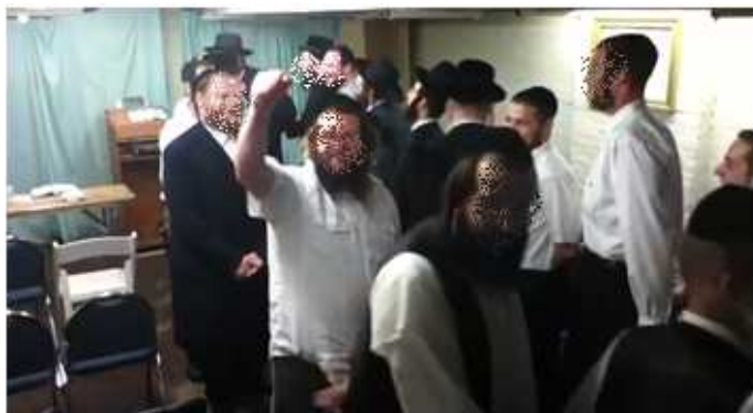
א פייערדיגער טאנץ אין "שטיבל"

אט קלימאקסירן זיי, ווען דער שבת אליין גייט באגריסן ווארעם די אנוועזנדע מיט א סאלא-שטיקל, און זינגט אליינס אפ א שיר ליום השבת. מען גייט אריין אין עקסטאז פון די הערליכע ווערטער. מען